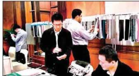
వస్త్రాలను పరిశీలిస్తున్న వ్యాపారి

WORLDDEX INDIA EXHIBITION & PROMOTION PVT. LTD.