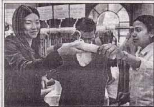
ತೈವಾನ್ ವಸ್ತ್ರೋದ್ಯಮ ಮೇಳ ಡಿಸೆಂಬರ್ 1 ಮತ್ತು 2ರಂದು ಬೆಂಗಳೂರಿನ ಒಪೆರಾಯ್ ಹೋಟೆಲಿನಲ್ಲಿ ನಡೆಯಲಿದೆ. ರಾಜ್ಯ ಮತ್ತು ರಾಜ್ಯದ ವಿವಿಧ ಕಡೆಗಳಿಂದ ವಸ್ತ್ರೋದ್ಯಮಿಗಳು ಇದರಲ್ಲಿ ಪಾಲ್ಗೊಳ್ಳುವ ನಿರೀಕ್ಷೆ ಇದೆ.