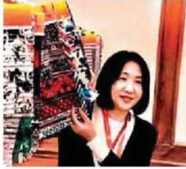
పట్టు వస్త్రాలను ప్రదర్శిస్తున్న తైవాన్ మహిళా వ్యాపారి

బెంగళూరు (శివాజీనగర), న్యూస్ టుడే : తైవాన్ నుంచి ఆయా రకాల వస్త్రాలను తెప్పించుకునే వ్యాపారుల కోసం తైవాన్ దేశ ప్రతినిధులు ఇక్కడి ఓబిరామ్ హోటల్లో ప్రత్యేక ప్రదర్శన నిర్వహించారు. కొన్నేళ్లుగా ఇదే తరహా ప్రదర్శనను దక్షిణ ఆసియా దేశాల్లో నిర్వహించుకుంటూ వస్తున్నామని తైవాన్ జవళి సమాఖ్య ప్రతినిధి సియాన్ ల్యాం తెలిపారు. మంగళ