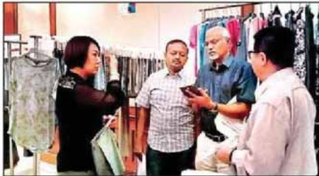
తైవాన్ వస్త్ర వ్యాపారులతో సానిక వ్యాపారుల చర్చలు

వారం ఇక్కడ నిర్వహించిన సమావేశంలో ఆయన విలేకరులతో మాట్లాడారు. బెంగళూరులో నిర్వహిస్తున్న ప్రదర్శనకు తిరుపూరు ఎగుమతిదారుల సమాఖ్య, భారతీయ వస్త్ర వ్యాపార మహా సమాఖ్యలు తమకు మద్దతు ఇస్తున్నాయని చెప్పారు. పాలిస్టర్, పట్టు, చర్మంతో తయారు చేసిన వస్త్రాలు, బ్యాగ్లు, ఇతర జవళి ఉత్పత్తులను ప్రదర్శనలో ఉంచారు.